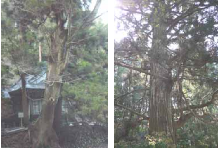
ケヤキ（大田原河内神社） スギ（相地竹尾）

今回の再発見は、『森の巨人』、平成二年に『徳山百樹』にも選定された中須にある大木たちをいくつかご紹介します。