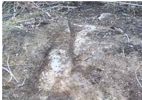
『岩には一本の長い筋が・・・縄の跡か・・・？』